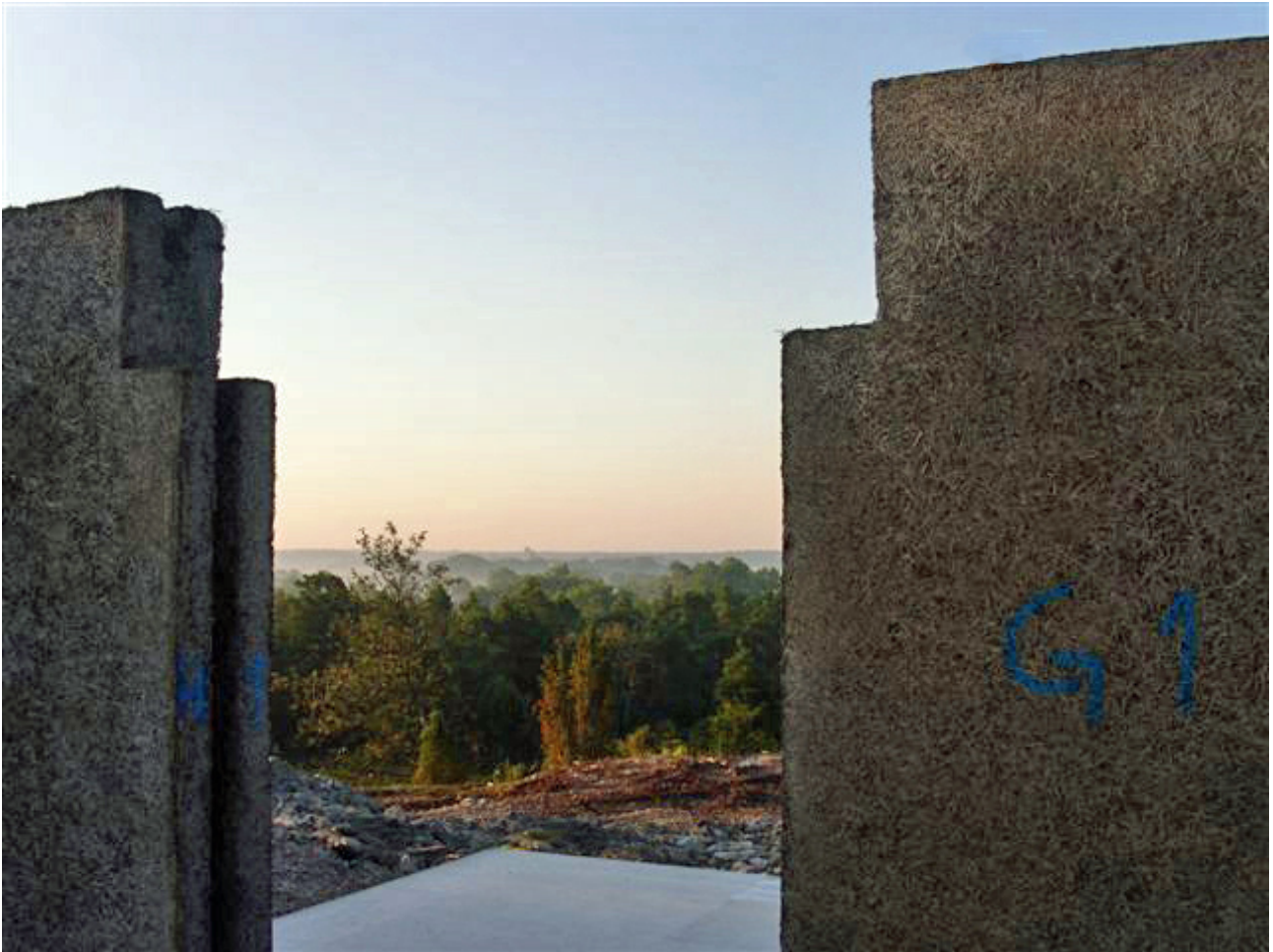
Ett hus av Trällits Helväggselement under uppbyggnad på Gotland